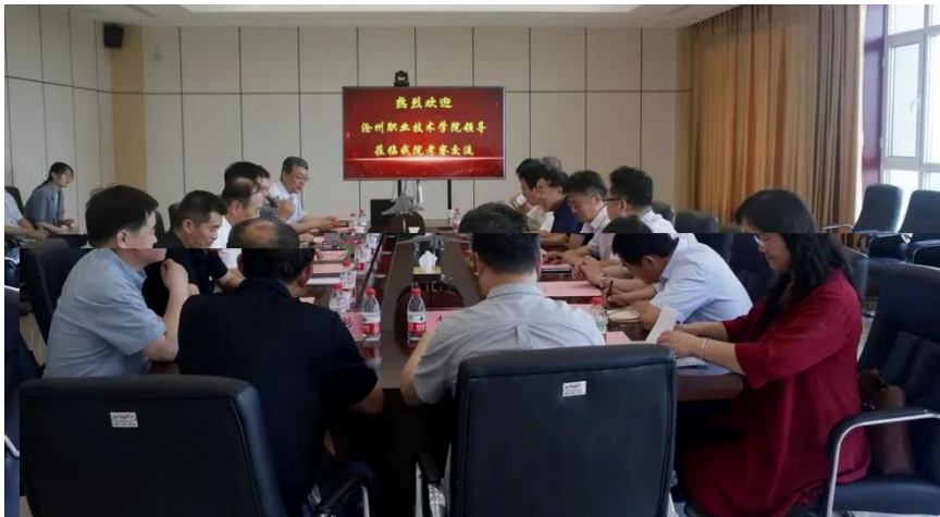
企 单 养 交